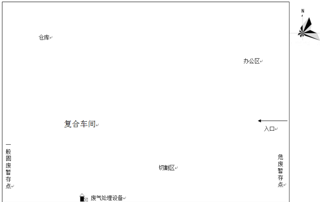
图 3-2 厂区平面布置图