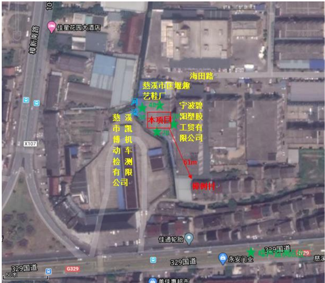
图 3-1 项目地理位置图