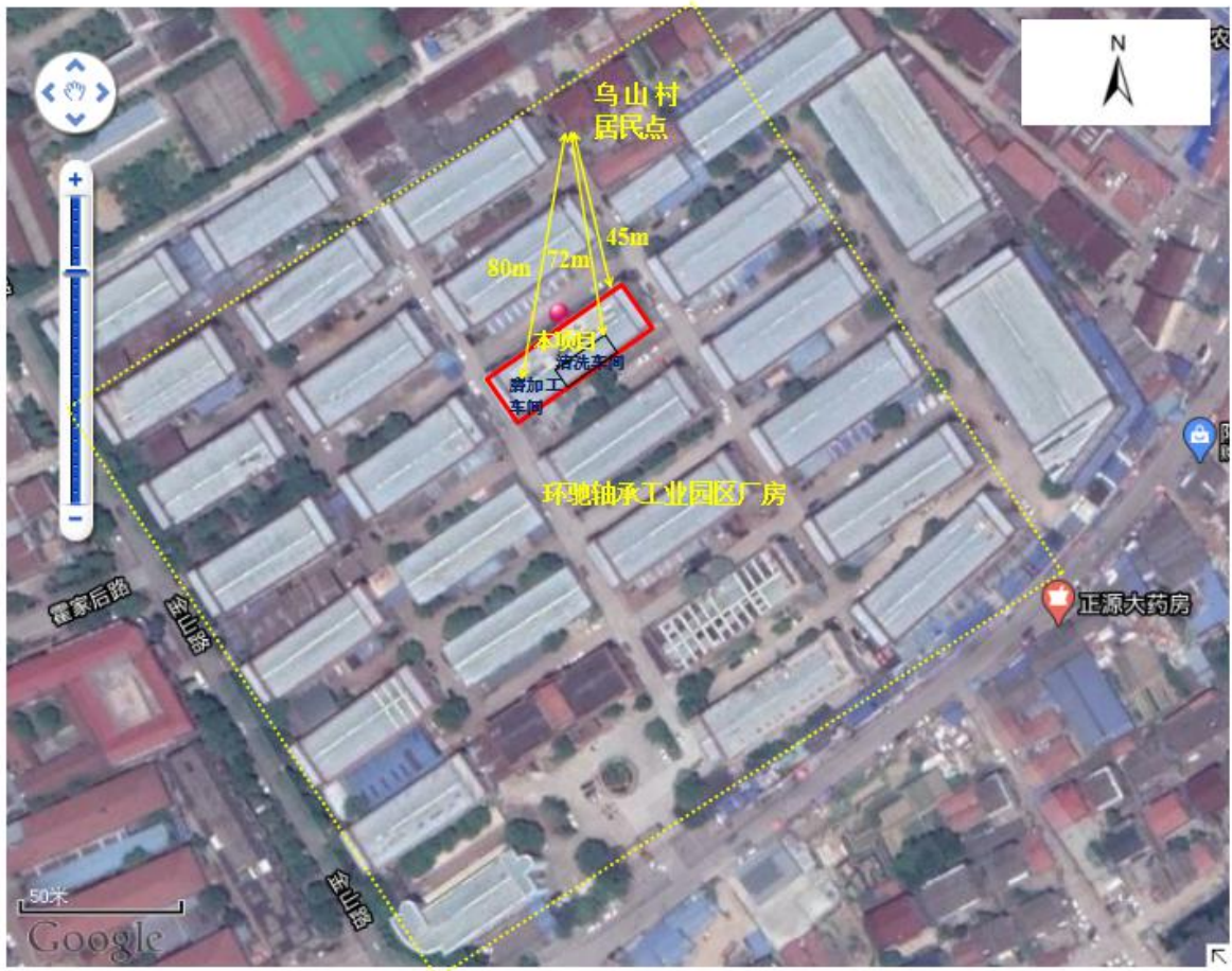
附件 2:本项目周围环境示意图