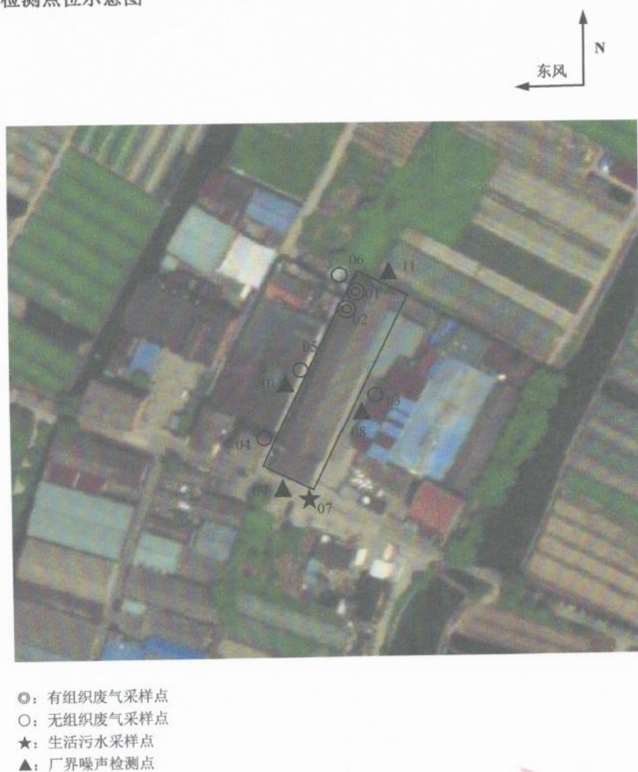
图 6-1 监测点位图